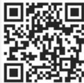
คู่มือการใช้งาน e-Request