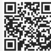
คู่มือการใช้งาน e-Voting

*หมายเหตุ การทำงานของระบบประชุมผ่านสื่ออิเล็กทรอนิกส์ และระบบ Inventech Connect ขึ้นอยู่กับระบบอินเทอร์เน็ตที่รองรับของผู้ถือหุ้นหรือผู้รับมอบฉันทะ รวมถึงอุปกรณ์ และ/หรือ โปรแกรมของอุปกรณ์ กรุณาใช้อุปกรณ์ และ/หรือโปรแกรมดังต่อไปนี้ในการใช้งานระบบ